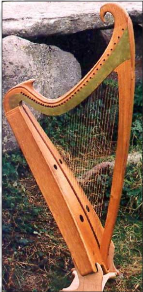
Sirr Harfe 37 Saiten, F-g"

Low-Headed Clairséach, Dublin/Trinity College, 15. Jahrhundert, 30 Saiten, a-b", Phosphorbronze.