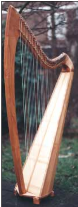
Modell Silmaril mit geschwungener Säule

33 Saiten, C-g ''' , Tynex- oder Darmbesaitung, Holzarten siehe Große keltische Harpe, Höhe 120 cm, Gewicht ca. 8 kg, Halbtonklappen ( Robinson oder Loveland ).