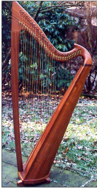
Modell Silmaril mit gerader Säule

36 Saiten, A-a ''' , Tynex- oder Darmbesaitung. Holzarten: Nußbaum, Wildkirsche, Ahorn, Eiche, Esche, Rotholz. Höhe 152 cm, Gewicht ca. 10-12 kg, Halbtonklappen in verschiedenen Ausführungen ( Robinson, Loveland oder Peter Brough ). Resonanzbodenholz: feinjährige Meraner Alpenfichte oder Sequoia gigantea (Mammutzeder).