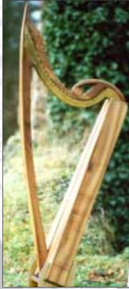
Mullagh-Mast Harfe 35 Saiten, G-f"

High-Headed Clairseach, 17. Jahrhundert, Nationalmuseumm Dublin, Phosphorbronze-Besaitung, exzellente Halbton- klappen (Bronze, P. Brough)