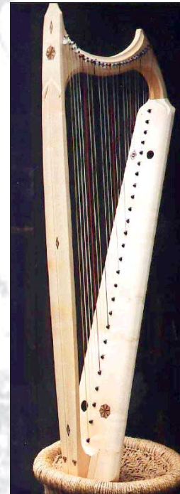
Wartburger Modell, 27 Saiten, F-d"