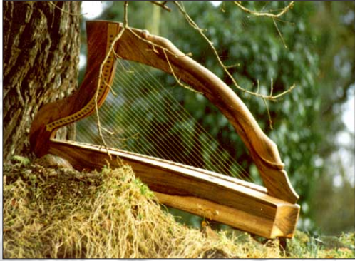
Brian Boru's Harfe

Low-Headed Clairséach, Dublin/Trinity College, 15. Jahrhundert, 30 Saiten, a-b", Phosphorbronze.