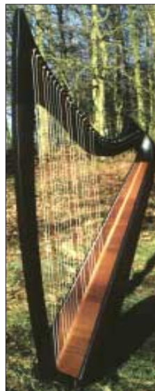
Silmaril , gotische Form